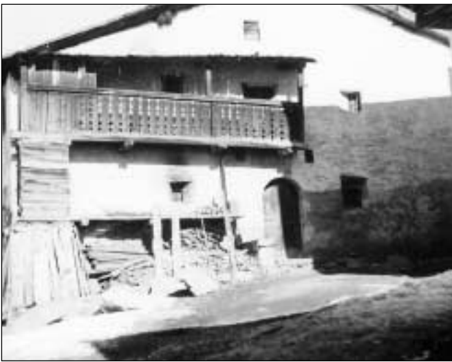
In'otra lautga sur l'entrada (Tinizong).