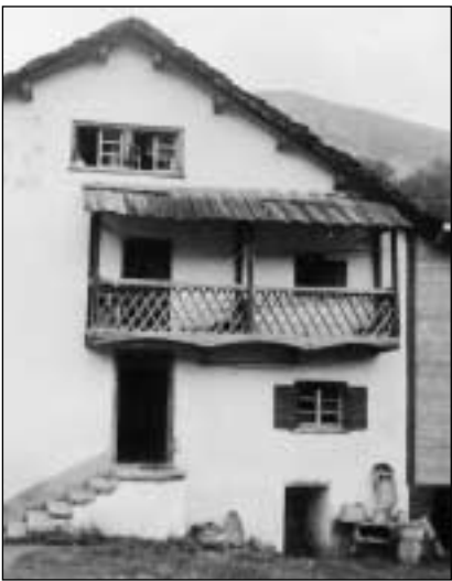
Lautga sur l'entrada (Casti, Schons).