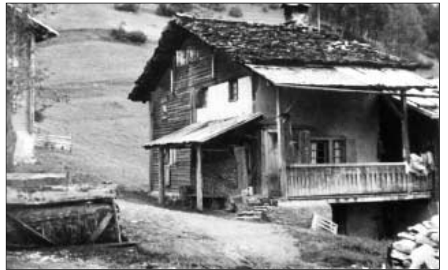
Gronda lautga al plaunterren (Sursaissa).