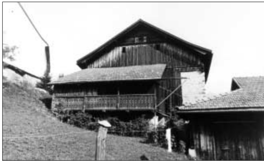
Lautga cul tetg da quadrels vi d'in clavà (stratga giu 1994 per fabritgar or il clavà; Ftan).