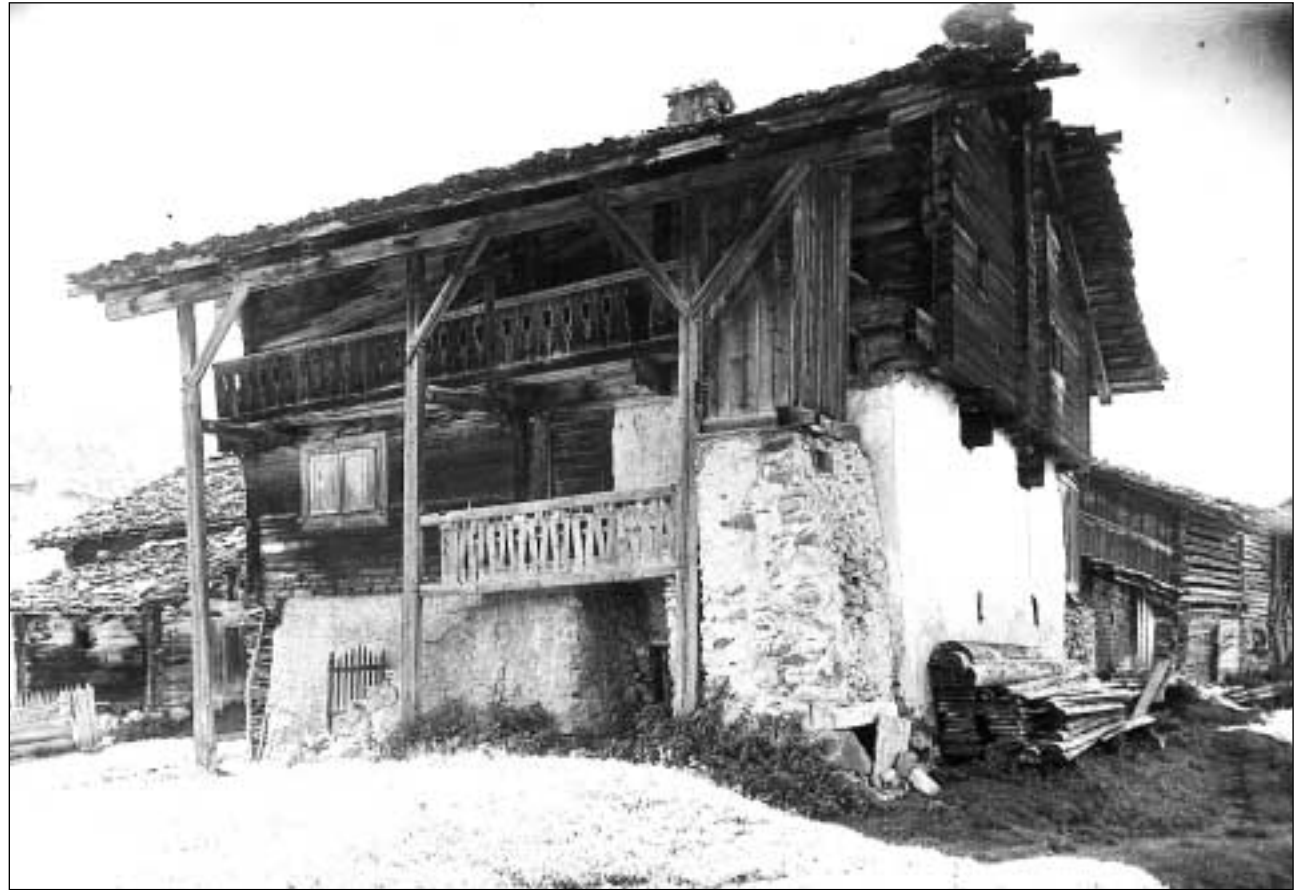
Lautga al plaun sisum che cuverna l'entrada cun la stgala ed il lautget (Sursaissa).

E perquai ch'en in chantun da la lautga eri savens il secret, ha il pled en tsherts lieus survegni questa significaziun. A Lantsch vuleva dir «oir sin loptga», ir sin secret, ed uschia fa er la suandanta frasa or da la Val Müstair tuttafatg senn: «La lobia es adüna da la vart davo chasa».