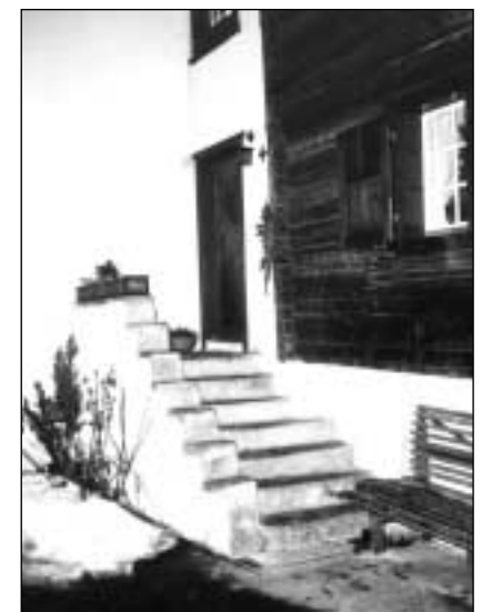
Lautget senza nagin tetg (Surrein).

(a sanester dal tut) Lautga che collia duas chasas, faschond da punt sur la via vi (Pignia). (a sanester) Lautga sur ina curt. Tranter la lautga e la curt èn andus locals cun be pitschnas fanestrettas, duvrads pli baud probabel sco chombras da durmir (Stierva).