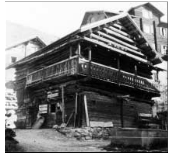
Lautgets vi d'in clavà (Cumbel, enturn il 1950).

Tar las chasas è la lautga adina dadorvart, ma i dat er lautgas endadens, per exempel en las baselgias. En bleras vischnancas eran las plazzas sin la lautga en baselgia reservadas als mats. «Ir sin la lautga» vuleva lura dir vegnir preni di en la cumpagnia da mats. Sevgein: «La