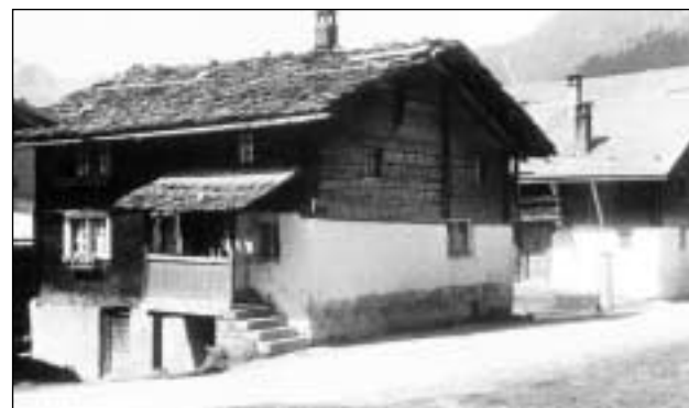
Lautget cuvert (Camischolas).

(a sanester dal tut) Lautga che collia duas chasas, faschond da punt sur la via vi (Pignia). (a sanester) Lautga sur ina curt. Tranter la lautga e la curt èn andus locals cun be pitschnas fanestrettas, duvrads pli baud probabel sco chombras da durmir (Stierva).